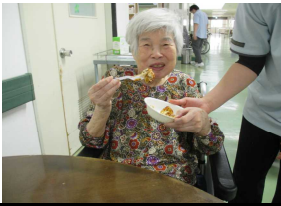
熱々をいただきます