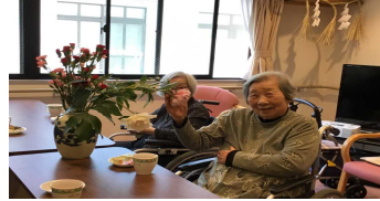
撮影(上) 記念の笑顔 撮り(下) たたきの様子

5月9日は母の日。グループホームでは、きれいなカーネーションを眺めながら皆さんとお茶会を開きました。また、日頃の感謝を込めて肩たたきも行いました。