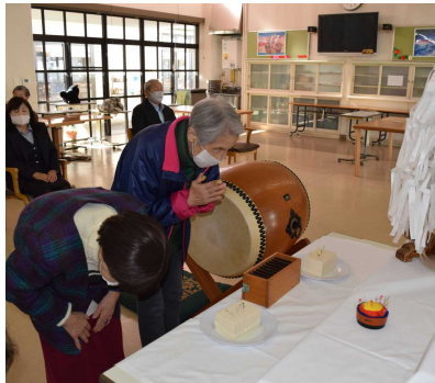
豆腐にやさしく針を刺して供養