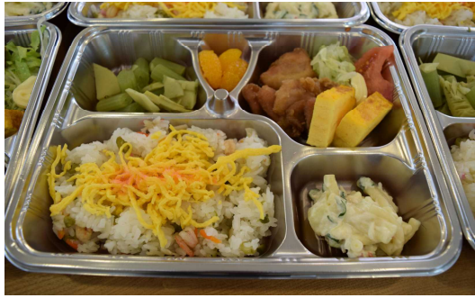
3 / 29 の花見弁当完成品