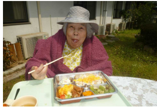
外で食べると最高です