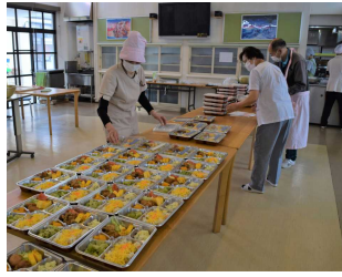
職員で協力し、お弁当作り