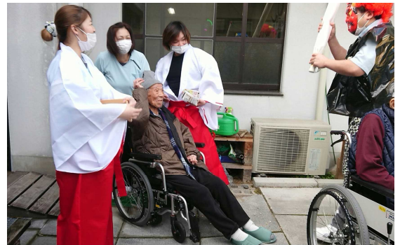
コロナウイルス等、悪気を払うべく菓子を投げました

2月2日(火)、豆まきならぬ、お菓子まき。鬼に扮した職員へ「鬼はく外、福はく内!」。