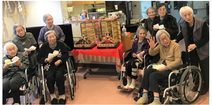
作品を持ってひな壇前で記念撮影