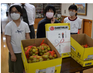
裏山でとれた沢山の梅の実

当苑が取得した個人情報は、適切に管理し、その利用、提供は同意を得た範囲に限定し、それ以外の第三者への開示、提供はいたしません。