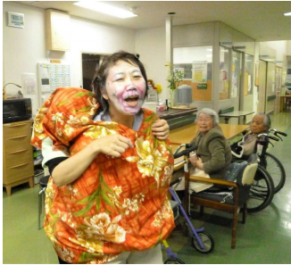
二人羽織を披露する職員

[みやこの苑広報第182号] 発行日/令和2年7月1日 発行/みやこの苑 行橋市大字二塚584番地 ☎(0930) 22-0231 http://miyako-no-sono.or.jp/ 編集/みやこの苑広報委員会