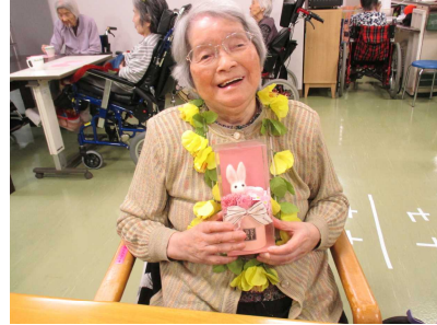
母の日、プレゼントを胸に記念撮影

今年はコロナウイルスが流行し、みやこの苑も外出や面会の自粛、3密を避けるため行事も縮小し対応。 みんなが楽しく過ごしてもらえるよう、演芸を披露したり、天気の良い時には施設の周りを散策するなどをしてい