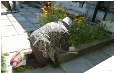
中庭の花壇を手入れする利用者

「きれいになって気持ちがいい。青空の下、体を動かしながらに気持ち良かった」と笑顔で話していました。