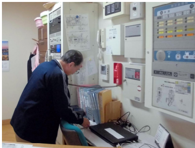
消防署に通報（訓練）