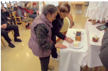
やさしく針をとうふへ