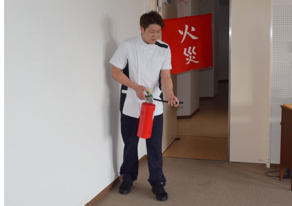
消火器にて初期消火開始（訓練）

毎年3回、避難訓練をしています。3月は13日に火災避難訓練を展開。今回は夜間にユニット特養から出火の想定で行いました。 訓練は「ジリジリ」の火災警報で開始。訓練者はそれぞれの部署にある火災報知器設備パネルの点灯を確認し、消火器を持って初期消火にあたりました。 今回は「消火困難」の設定で次の動作へ。指揮者は近くの利用者から避難指示し、消防署へ通報や職員緊急応援等