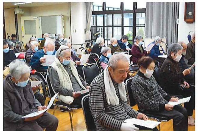
みんなで歌いました。