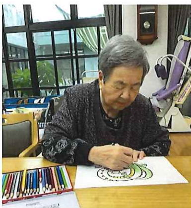
作品を作っている様子

行橋コスメイトで11月、12月に開催された「いきいき作品展」に出品しました。市内のデイケアやデイサービス、在宅支援等を利用していらっしゃる高齢者の方々が作成された模型や壁掛けなど様々な作品が展示されます。グループホームから代表者2名が見学に行きました。自分