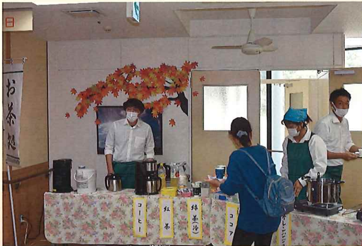
コーヒーや紅茶でおもてなし