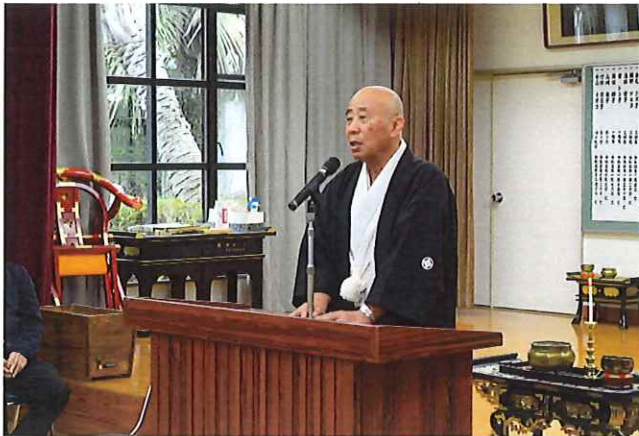
理事長の挨拶の様子

1月1日、新年を迎えたお祝いとして、毎年恒例の式典が行われました。理事長が、集まったご利用者様へ新年の挨拶を行ったあと、式典に参加しているみなさんと、「♪と♪のはじめのためしとて♪」でおなじみの童謡『一月一日』を歌いました。みなさん歌詞カードを見ながら楽しそうに大きな声で歌わっていました。