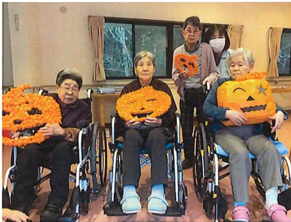
おぼけかぼちゃと一緒に「チーズ!」