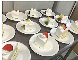
美味しそうなケーキ

12月24日、クリスマス会を行いました。特養では、スタッフが用意したスポンジにクリームやフルーツで飾りつけをしました。