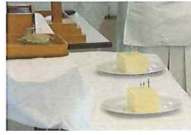
感謝の気持ちを込めて豆腐に針を刺します。

2月8日、針供養を行いました。苑ではご利用者様が身の回りのつくりものを楽しんだり、趣味で手芸を楽しんだりして針を使う機会が多いため毎年針供