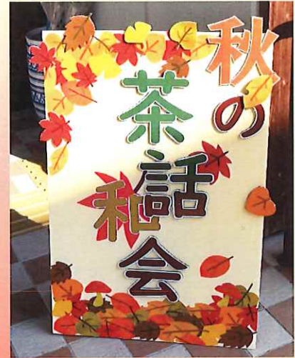
ご家族様を出迎える看板