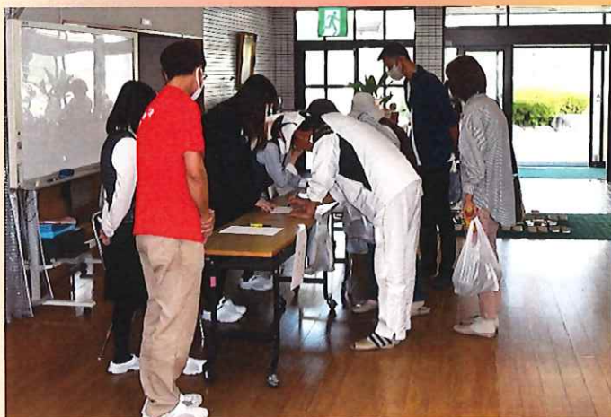
たくさんのご家族様が来苑される様子