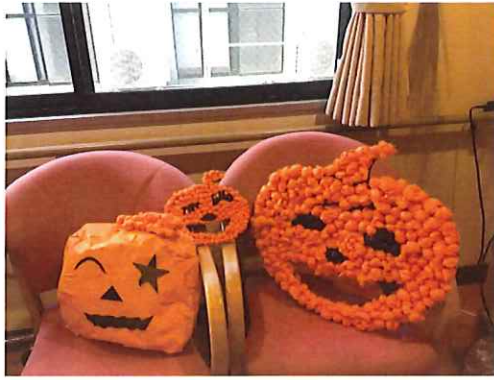
みんなで作ったおぼけかぼちゃ。かわいっ。

当日は、ご利用者様みんなで作ったおぼけかぼちゃと写真を撮ったり、お菓子を食べたりと楽しい時間を過ごしました。