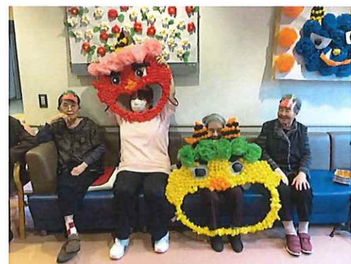
自分たちで作った鬼を持って「鬼は一外!」