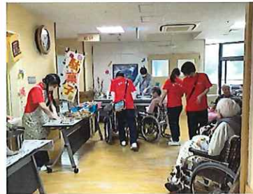
一銭焼きを待っています

2月19日、「昔なつかし駄菓子屋さん」と銘打って懐かしいお菓子などを食べていただくイベントを開催しました。屋台で