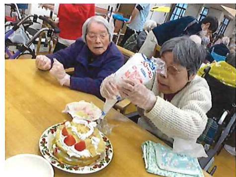
ケーキにクリームを絞ります。楽しい!

ユニットでは、お菓子のつかみ取りや日用品が当たるくじ引き大会を行いました。みなさんとても楽しそうにクリスマスイブを楽しまれました。