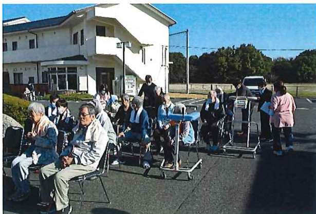
外へ避難する訓練の様子

を行いました。当苑では火災や自然災害の発生を想定した訓練を年に3回行っています。当日はスタッフ、ご利用者様が参加して、実際に避難経路を確認したり、消火器を使って消火訓練を行いました。