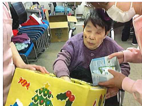
なにが当たるかなー?ドキドキ。