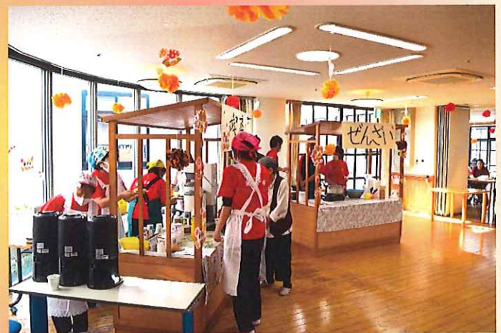
飲み物とぜんざいでおもてなし