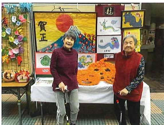
みなさんで作った作品の前で記念撮影